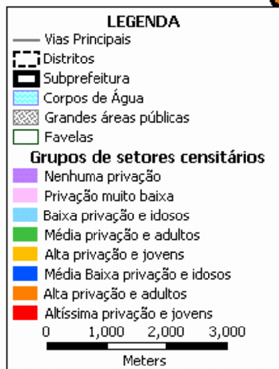
Mapa I.3.1. Grupos de setores censitários classificados segundo privação e ciclo de vida familiar*. Município de São Paulo - Subprefeitura Perus.